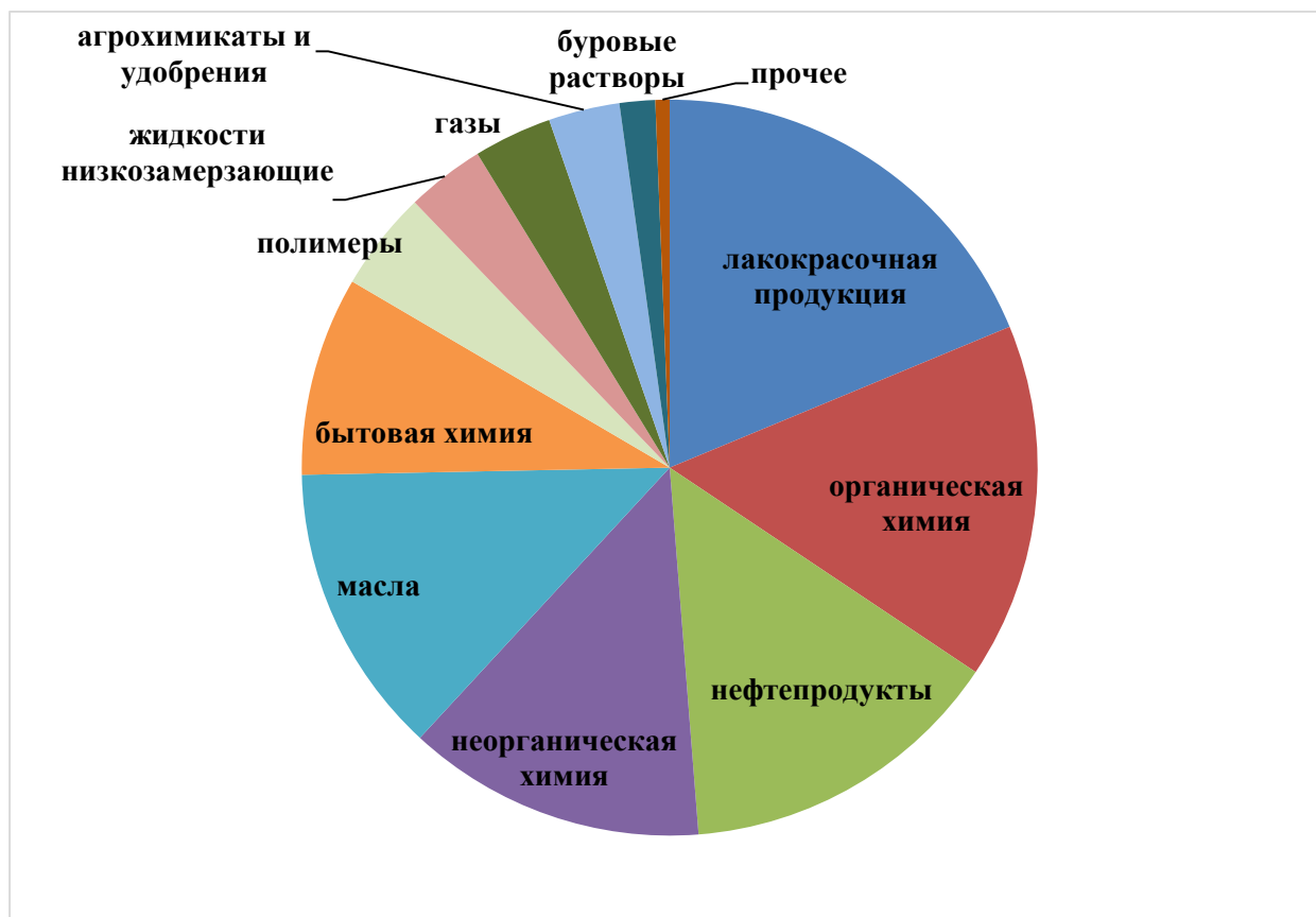
Рис. 4. Распределение видов химической продукции, на которую поданы ПБ для регистрации в марте 2017 г.

Что касается продукции, документы на которую поступили для регистрации в марте 2017 г., то бóльшую ее часть составляют: лакокрасочные продукты, нефтепродукты, масла, продукты органической и неорганической, бытовой химии (рис. 4). Помимо этих видов продукции, многие организации регистрируют ПБ на агрохимикаты и удобрения, газы, полимеры, незамерзающие жидкости, буровые растворы и прочие виды химической продукции.