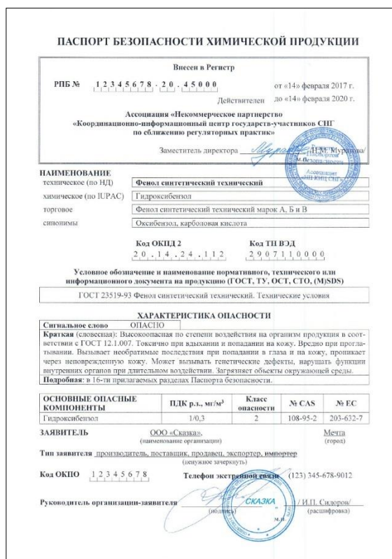
Рис. 1. Пример титульного листа ПБ химической продукции РФ.

В соответствии с СГС, в ПБ должно содержаться краткое резюме/заключение с обобщением приведенных в нем данных, предназначенное для того, чтобы облегчить для неспециалистов в рассматриваемой области идентификацию каждой из опасностей вещества/смеси [2]. В качестве такого резюме в ПБ РФ выступает титульный лист (рис. 1).